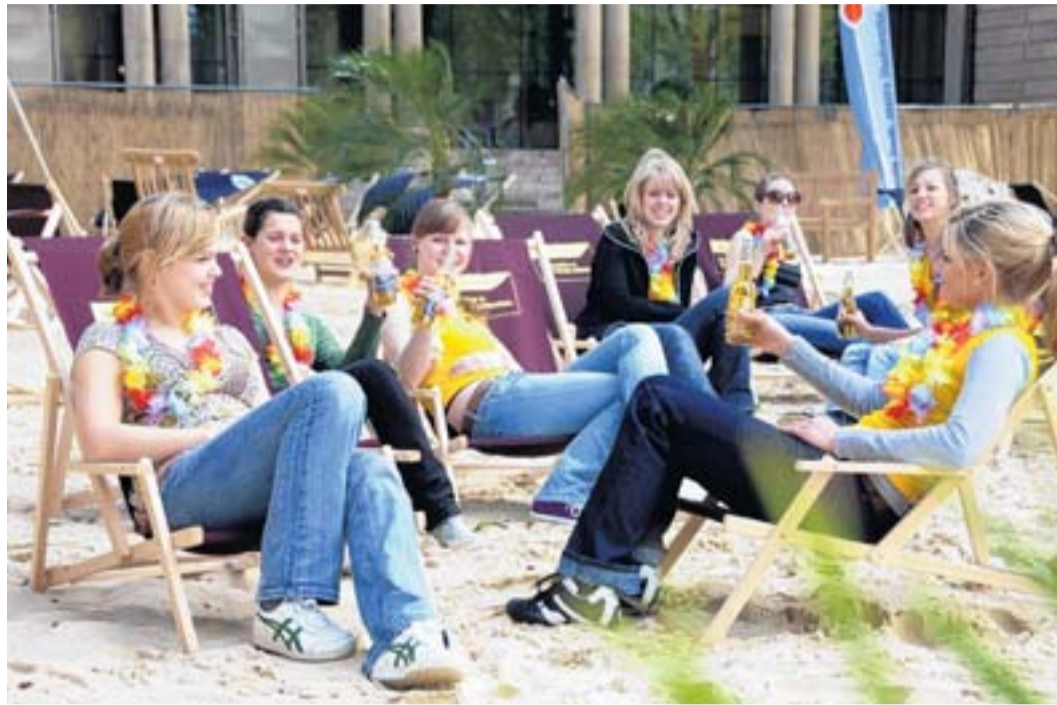
Ab heute ist es wieder soweit: Strandvergnügen mitten in Wuppertal.

Viel mehr als ein Rastplatz von der Shoppingtour ist die schönste und größte Strandbar im Bergischen Land. Sie bietet einen wunderbaren Ausblick auf die ganze Stadt. Urlaubsflair unter Palmen ist garantiert.